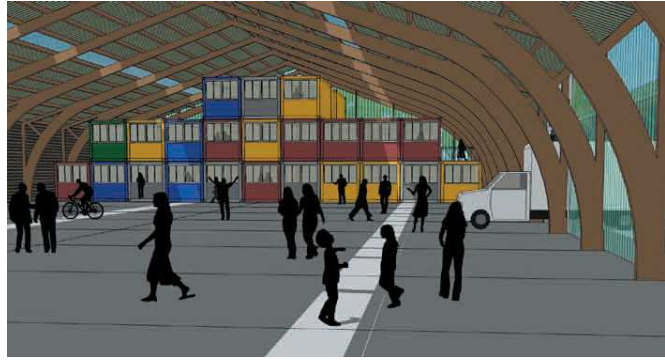
...et après, avec vue sur les bureaux-containers