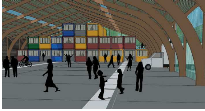
...et après, avec vue sur les bureaux-containers