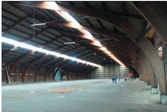
La Halle avant....