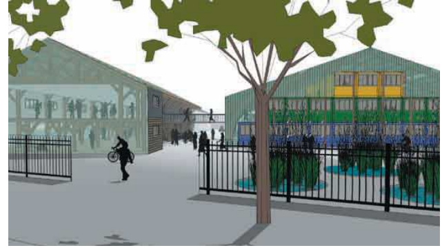
Vue de la future entrée piétonne