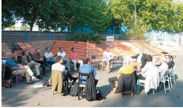
Atelier de co-construction