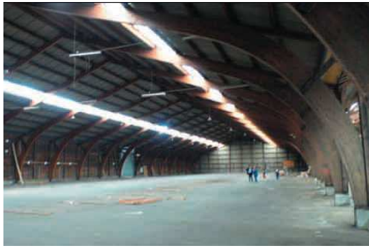
La Halle avant....