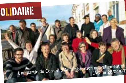
Une partie du Conseil d'Administration nouvellement élu (AG du 28/04/09)

Placer l'humain avant le profit, créer de l'emploi et des richesses, consommer et entreprendre autrement, valoriser la coopération plutôt que la concurrence, tout en tenant mieux compte des femmes, des hommes et de l'environnement... Voici quelques unes des valeurs de l'économie sociale et solidaire.